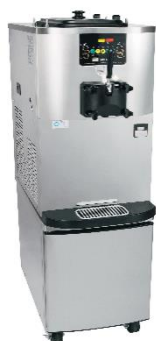
Chariot en option avec porte frontale