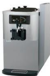
Décharge d'air optionnel