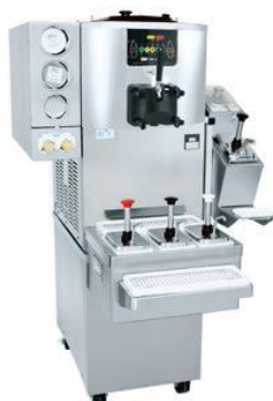
Chariot en option avec porte arrière pour le montage avant du rail de sirop