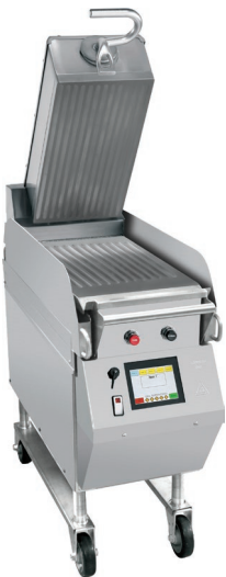
Model G828 Includes grooved upper platen and lower cooking surface.