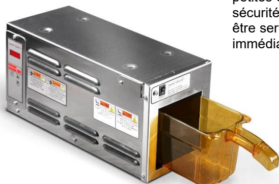
Armoire multifonctionnelle modulaire MPC 1L

Le tiroir profond est dimensionné pour accepter une variété d'articles de menu. La construction moulée d'une seule pièce avec une poignée à prise facile n'interfère pas avec le flux de travail de l'équipe et résiste au traitement de cuisine commerciale le plus difficile.