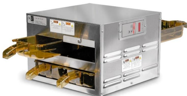
Armoire multifonctionnelle modulaire à double accès MPC 222

Les armoires polyvalentes Henry Penny sont idéales pour garder de petites quantités de plats chauds en sécurité, appétissantes et prêtes à être servies ou emballées immédiatement.