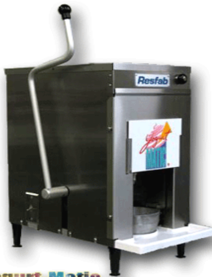
Yogurt-Matic 920 - 925